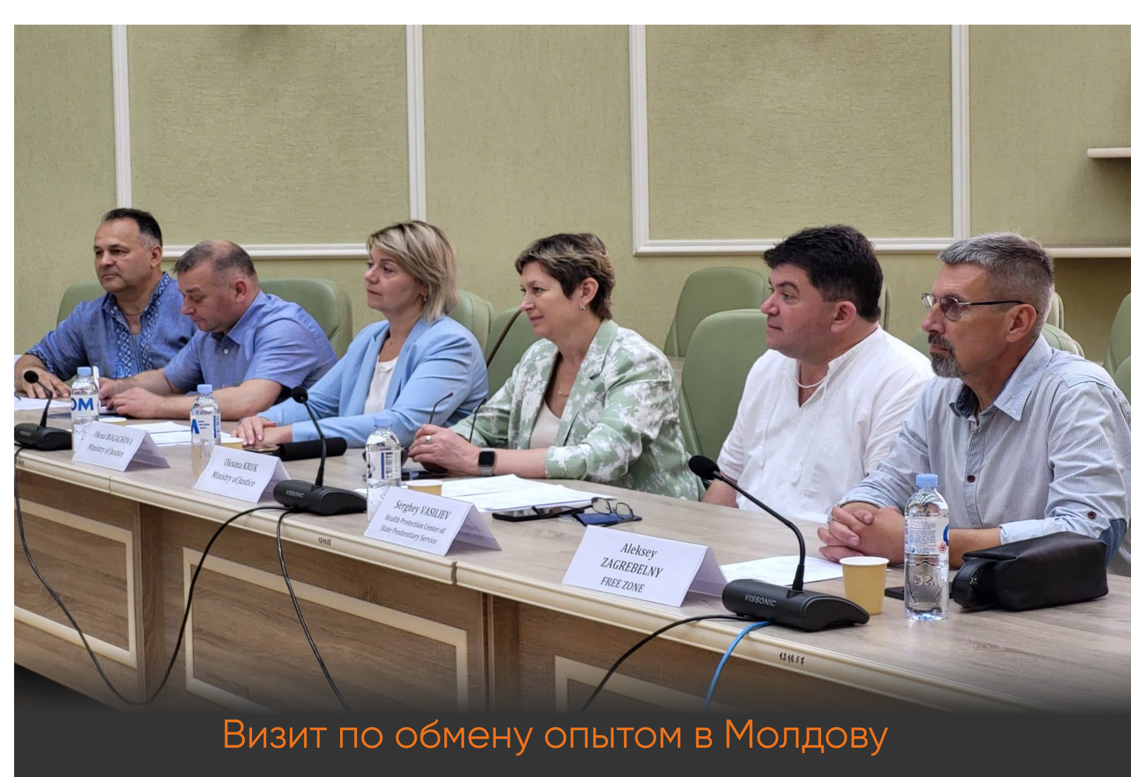
Визит по обмену опытом в Молдову