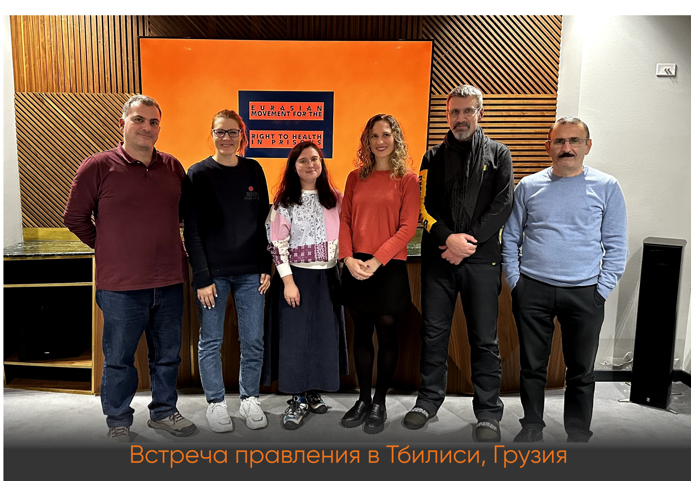
Встреча правления в Тбилиси, Грузия