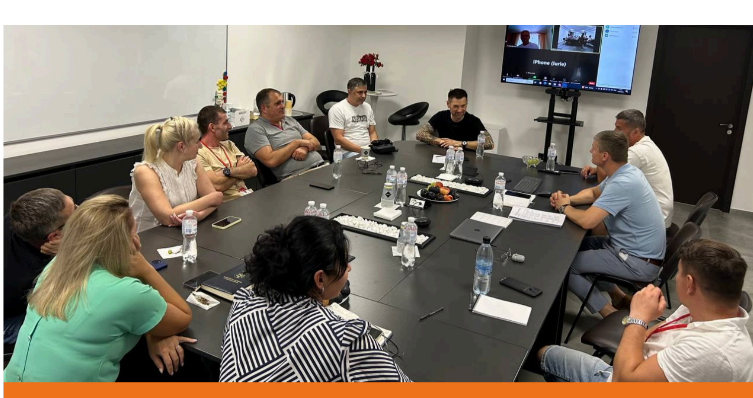
Инициативная группа, Молдова