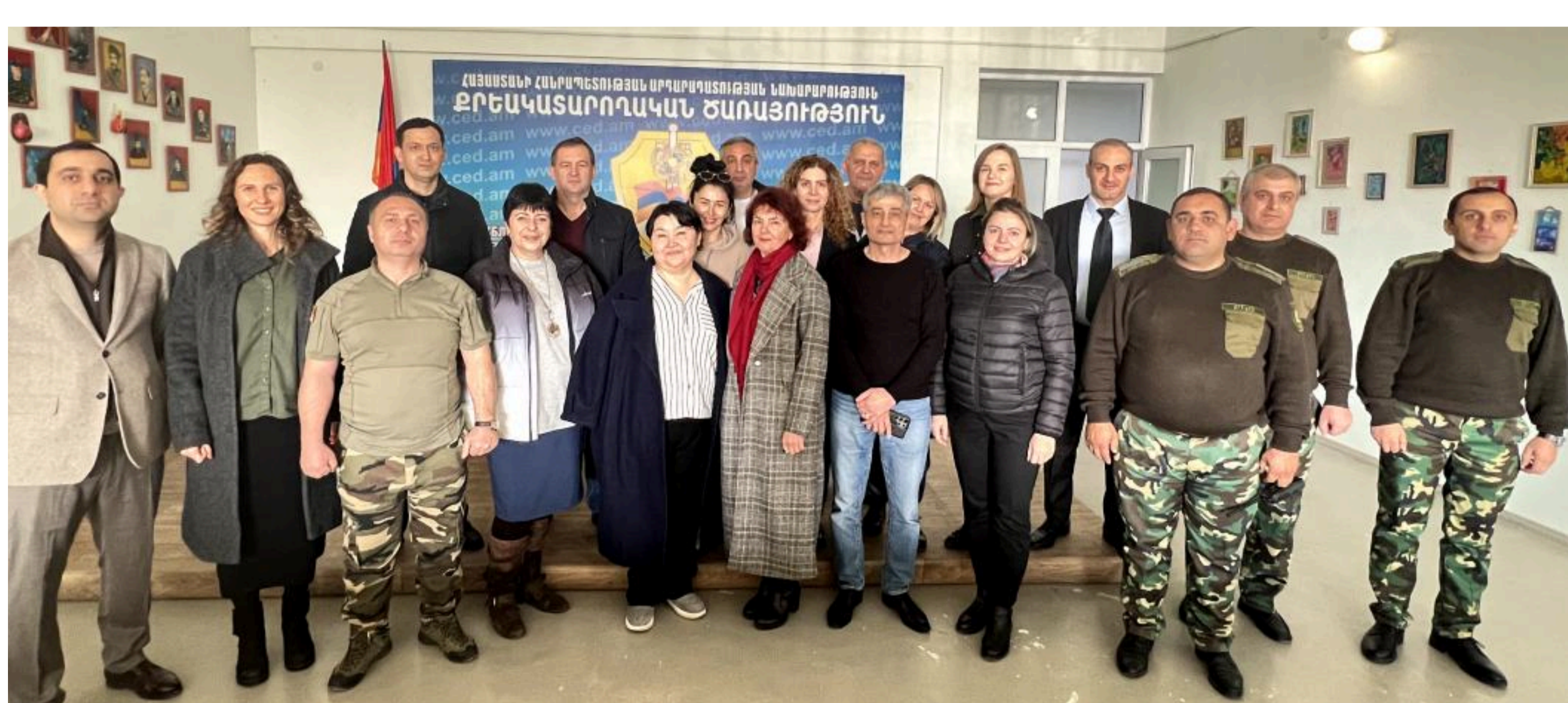
Региональная консультация «Перспективы реформирования системы пенитенциарной медицины в регионе ВЕЦА»