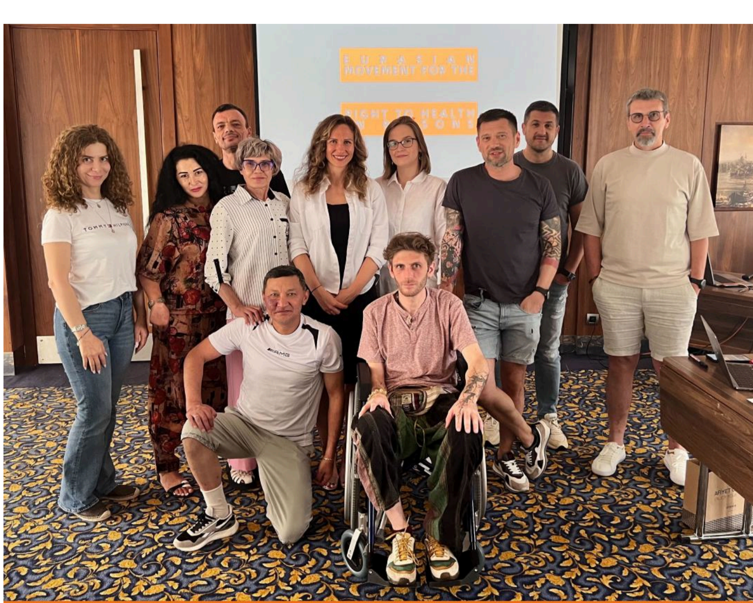
Встреча представителей сообщества

при финансовой поддержке Фонда Роберта Карра